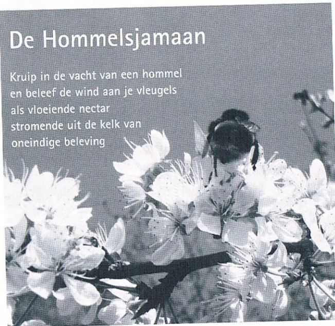
Tekst en foto: Sjoerd Bonnema

Kruip in de vacht van een hommelp en beleef de wind aan je vleugels als vloeiende nectar stromende uit de kelk van oneindige beleving