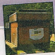
Sjoerd Bonnema toont een bijenhote in zijn tuin

De imkersvereniging Ooststellingwerf is opgericht op 10 juni 1898 en bestaat dus 114 jaar. Daarmee is het de oudste imkersvereniging van Nederland.