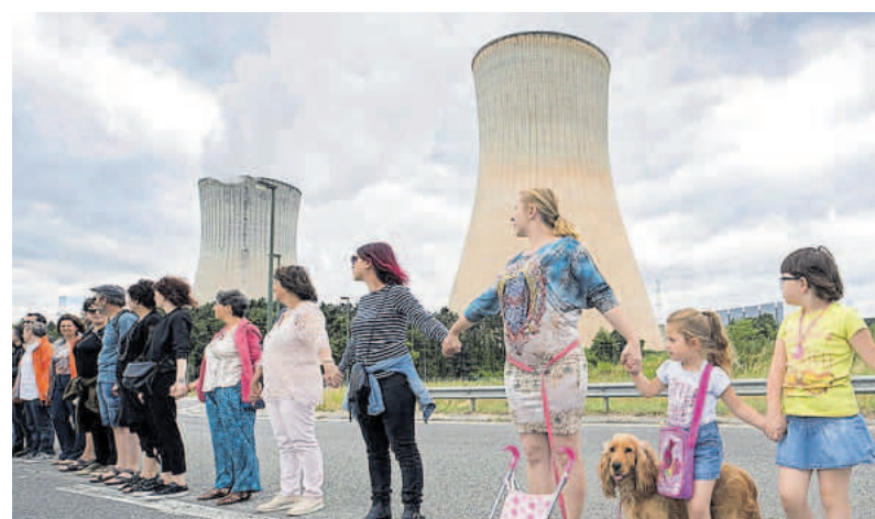
Een menselijke ketting als protest tegen de Belgische kerncentrale in Tihange, België, 25 juni 2017.

En dit is maar een van de vele voorbeelden. Hoe kan Kalantar-Nayestanaki wel de rampen in Bophal (Union Carbide, India 1984) en de Banqiaodam (China, 1975) benoemen, maar deze ecocide niet? Het lijkt met de woorden van Omtzigt wel wat op de wit weggelakte stuk-